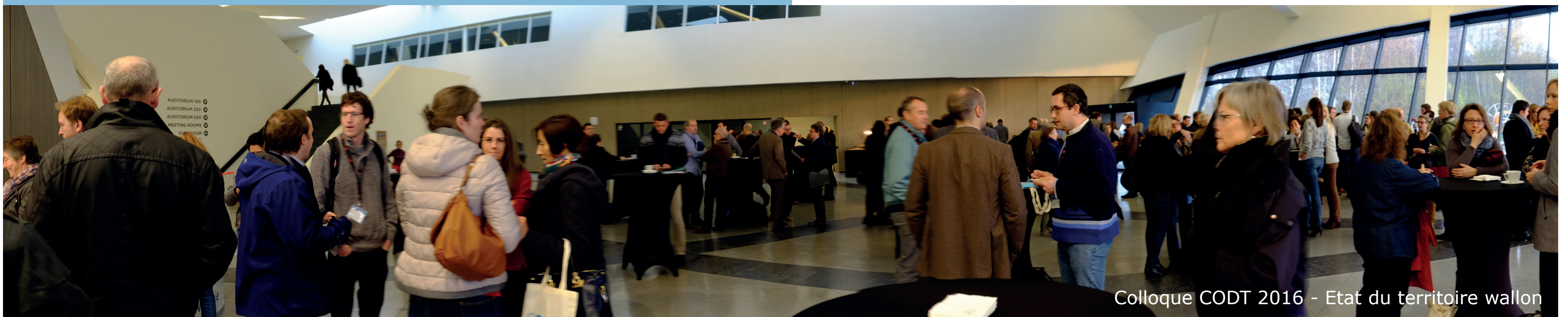
Colloque CODT 2016 - Etat du territoire wallon