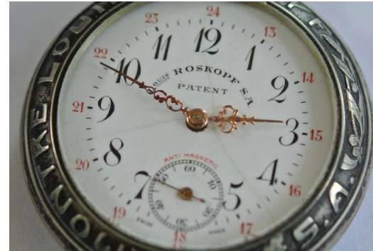
Ex: La Chaux-de-Fonds (centre l'arc horloger)