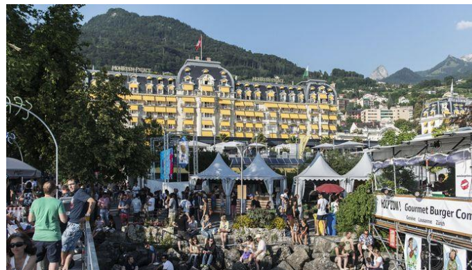
Ex: Le festival de jazz de Montreux

→ Experience economy, services personnels, immobilier, etc.