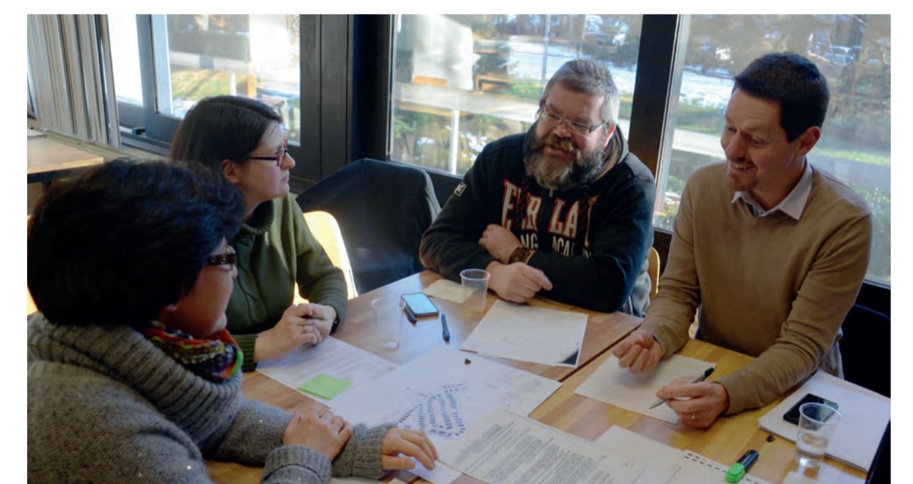
La motivation des permis et autres actes administratifs : atelier en sous-groupe de travail

Des interventions par les formateurs et des intervenants extérieurs alimentent le travail d'atelier.