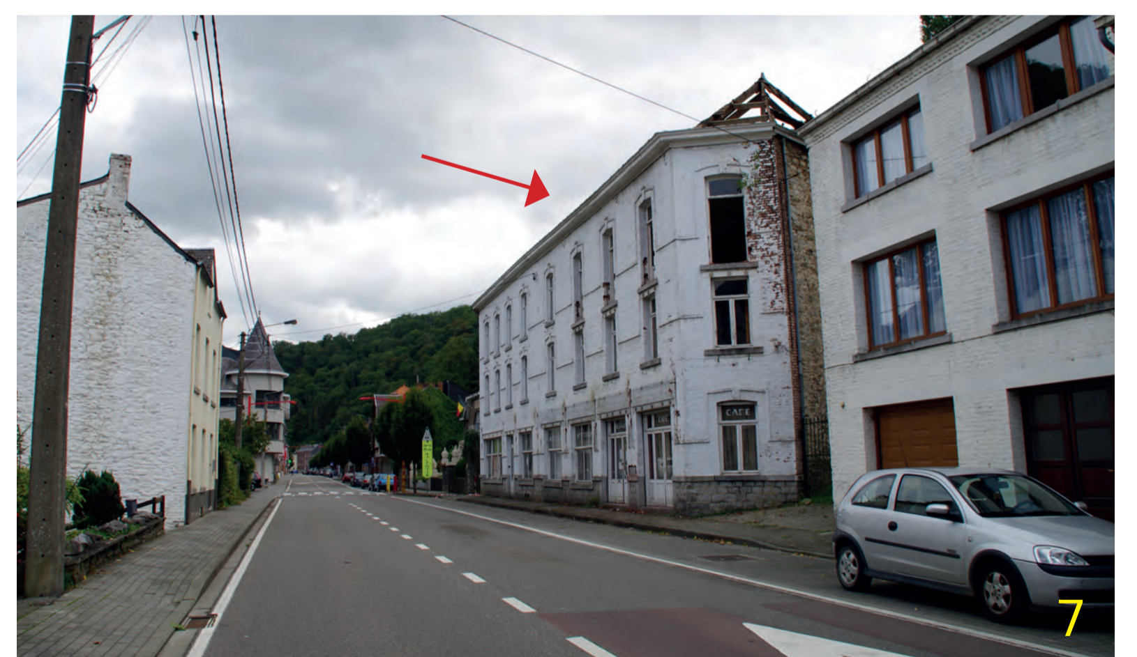
Dans la rue principale d'Anseremme, l'ancien hôtel de la Meuse, exploité ensuite comme café, est à l'abandon.

Nombre de ces bâtiments reflètent l'accroissement progressif de leur capacité d'accueil, consécutivement à l'augmentation de la demande touristique. Ils ont connu au fil du temps diverses transformations comme un rehaussement, l'ajout d'une aile et/ou d'annexes. A partir des années 1950, d'autres modèles hôteliers et d'autres formes architecturales vont apparaître progressivement.