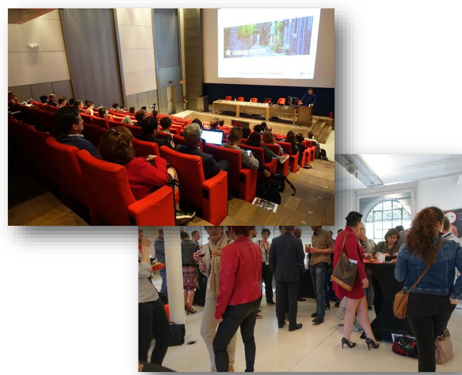
Deux séminaires par an