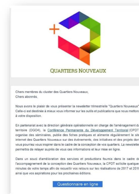
Une newsletter et une alimentation mensuelle du site web