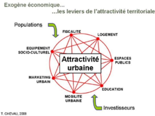
Figure 1 : Les leviers de l'attractivité territoriale