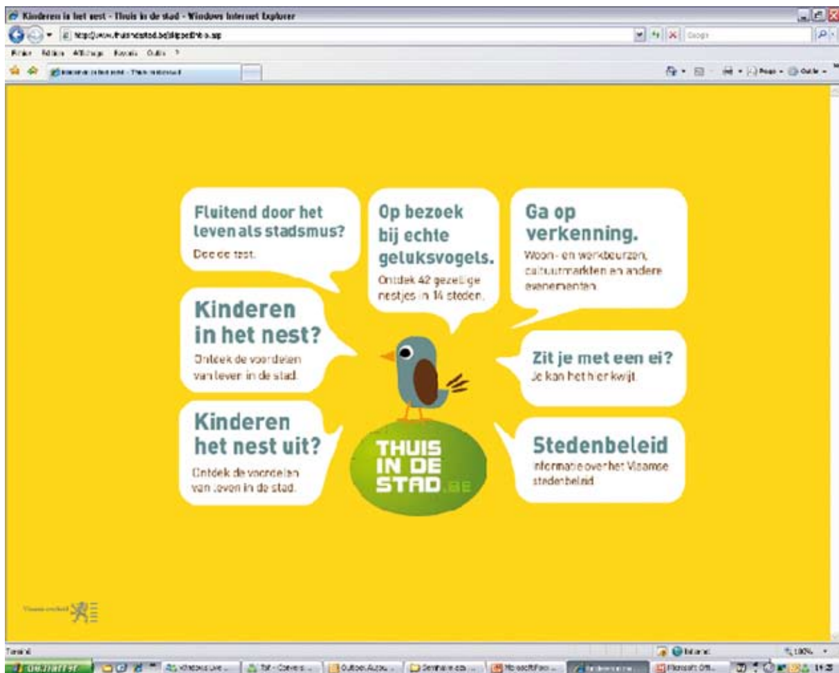
Figure 4 : Informer pour promouvoir la ville. Site internet www.thuisindestad.be , une manière d'informer la population sur ce qui se fait en matière de politique de la ville, mais également une manière de promouvoir la vie en ville sous toutes ses facettes.