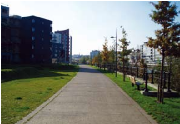
Aménagement lent des berges de l'Escaut à Gand Photo : T. Cheveau ■

La gestion de la mobilité semble être un élément capital dans les choix opérés. Vraisemblablement, une mobilité intelligente se doit d'offrir une qualité optimale à la nature des déplacements intra-urbains (rapidité, couverture et fréquence importante des transports en commun, valorisation des modes lents, mise à disposition du citoyen de moyens de transports non polluants...) et