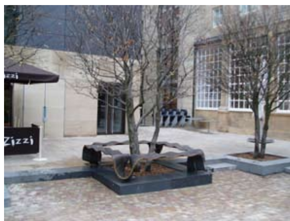
Figure 3 : Investir dans les espaces publics. Sheffield Gold Route, un sentier qui mène les investisseurs au cœur de la ville... ■