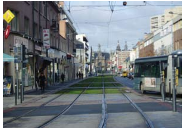
Valencienne propose un réseau de transport en commun performant durable (tramway) et une valorisation importante des modes lents (marche et vélo) en centre - ville. Photo : T. Cheveau ■

extra-urbains (le visiteur de passage, l'investisseur et le travailleur-navetteur doivent trouver leur compte au sein du compromis coût - vitesse - confort). Dans les trois centres visités dans le cadre de l'expertise (Sheffield, Gand, Valenciennes), nous avons pu remarquer l'implantation d'un réseau de transport en commun performant durable (tramway) et une valorisation importante des modes lents (marche et vélo) en centre - ville.