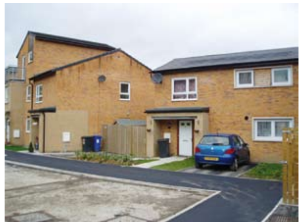
Figure 2 : le dispositif de l' Housing Market Renewal Pathfinder en image. Norfolk (Sheffield), la photo du dessus représente les logements avant démolition/reconstruction/privatisation, celles en-dessous après.

Certains dispositifs afférents au logement ont été observés. Par ces biais, ils espèrent engendrer le renforcement de la qualité de vie, du confort et du sentiment de sécurité : des valeurs importantes pour les populations. A l'instar de l' Housing Market Renewal Pathfinder anglais, des démarches de rénovation et de démolition-reconstruction peuvent contribuer à assainir l'image d'un quartier et permettre l'arrivée de nouveaux habitants dans un souci de mixité sociale et culturelle (figure 2). La question du maintien d'un parc suffisant de logements sociaux reste toutefois cruciale pour garantir l'accès de tous à un logement décent.